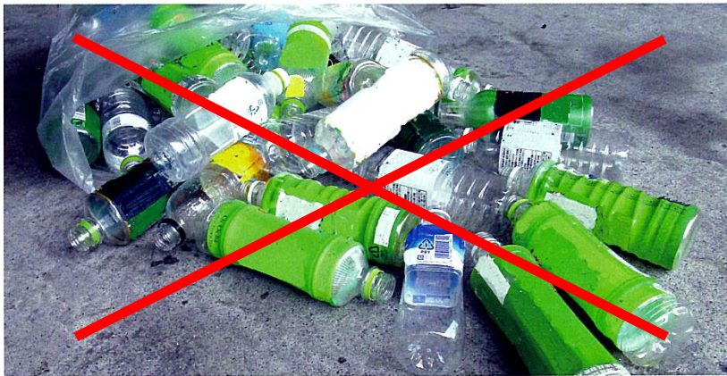
正しく分別されていないペットボトル(例)